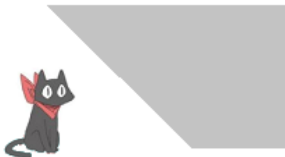
Иллюстрация к первому примеру: